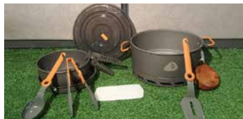
ENSEMBLE DE VAISSELLE

Non-fournies (Il s'agit du modèle compatible avec le poêle de camping)