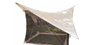
MOUSTIQUAIRE DE CAMPING EUREKA - VCS 16 MESH ROOM

Pour 4 personnes de 5'5 et moins ou 3 personnes plus grandes