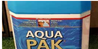
BIDON D'EAU (20 LITRES)