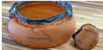
BASSIN POUR VAISSELLE (PEREGRINE)

Pour recouvrir et augmenter l'imperméabilité de la tente. Prévoir une bâche pour mettre au-dessus de la tente et une pour en dessous.