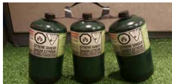
BONBONNES DE PROPANE

Non-fournies (Il s'agit du modèle compatible avec le poêle de camping)