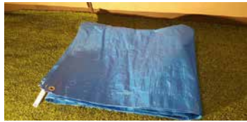
BÂCHE (6' x 8')

Pour recouvrir et augmenter l'imperméabilité de la tente. Prévoir une bâche pour mettre au-dessus de la tente et une pour en dessous.