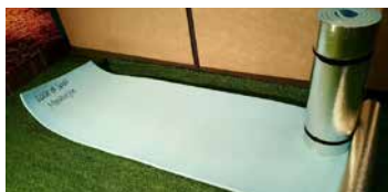
MATELAS DE SOL (EN MOUSSE)