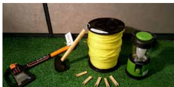
HACHE, MASSE, CORDE, ÉPINGLES À LINGE, LANTERNE