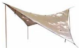
TOILE EUREKA (BÂCHE) - VCS 16 TARP