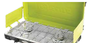
POÊLE DE CAMPING EUREKA! - SPIRE LX